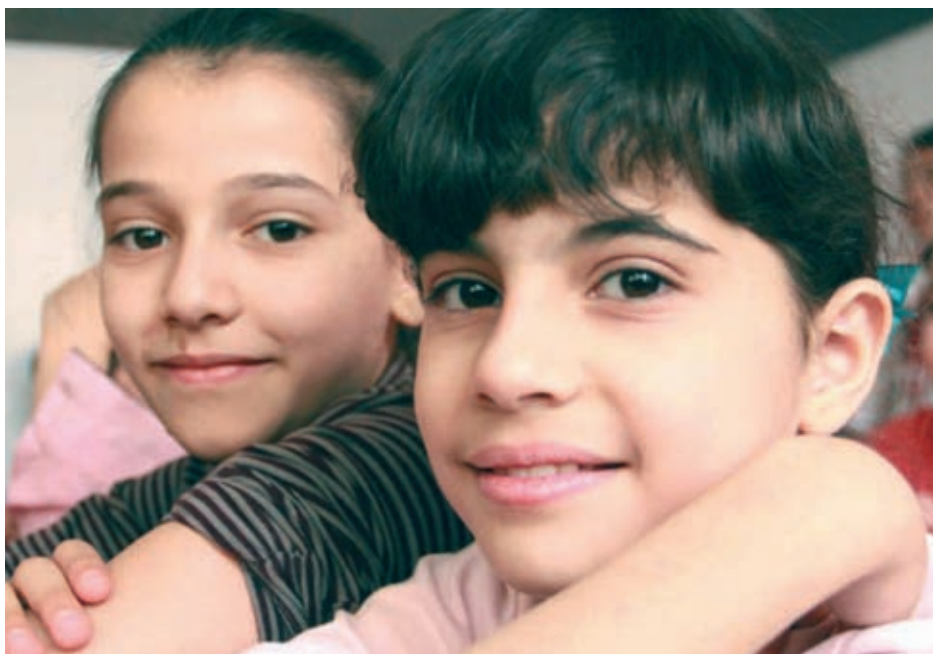
Две момичета в училище в Дамаск очакват реда си да бъдат ваксинирани в рамките на подкрепяна от УНИЦЕФ кампания за имунизирване на 2.4 млн деца с животоспасяващи ваксини.

След потвърдените 13 случая на заразяване с див полиомиелитен вирус в Сирия в региона ще бъде извършена масова ваксинация срещу полиомиелит и други предотвратими болести