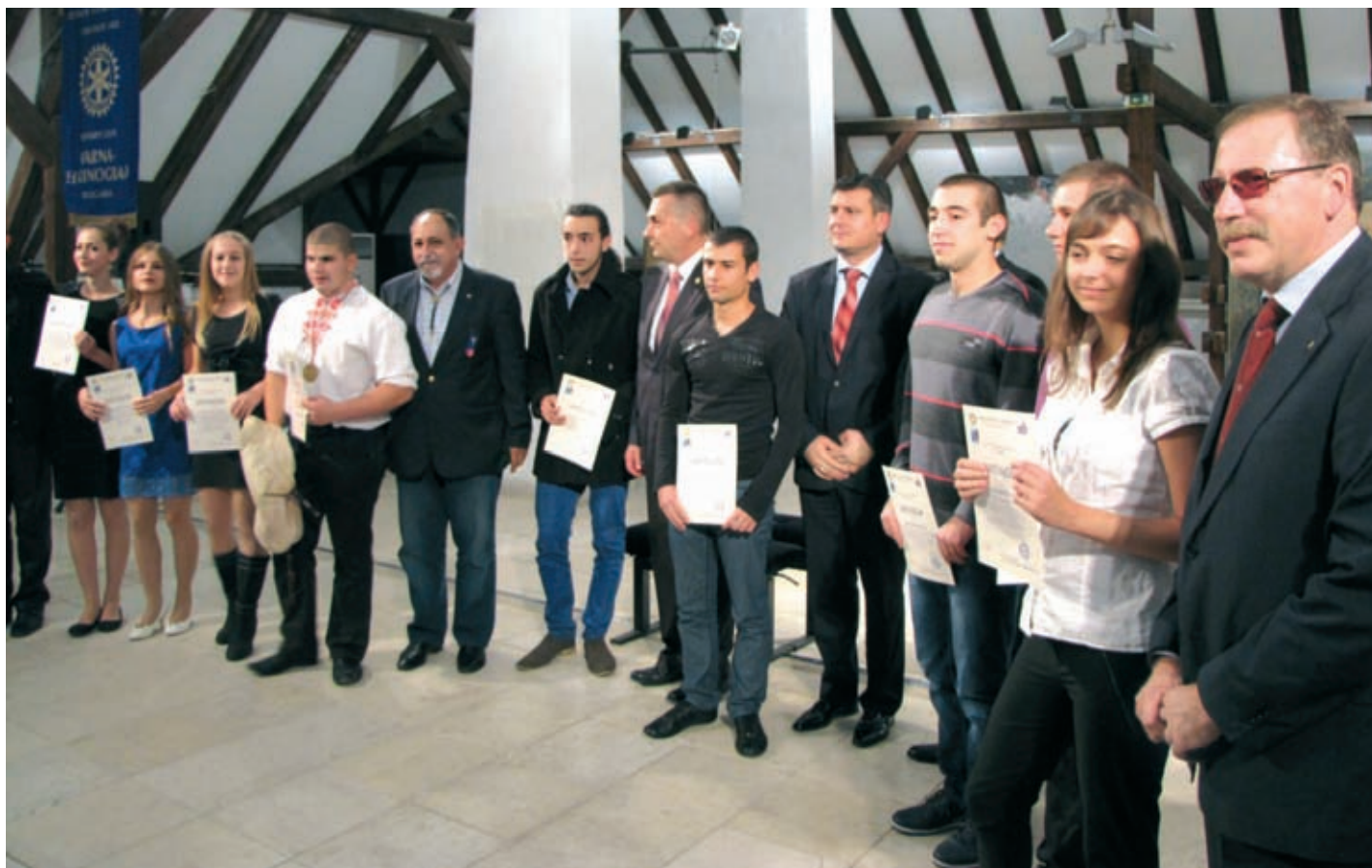
Част от наградните средношколци

В четирите категории с Диплом и парична премия бяха отличени още 11 изявени средношколци от Първа езикова гимназия, Гимназията по туризъм „Проф. Асен Златаров“, Професионалната техническа гимназия, Варненска търговска гимназия „Г. Раковски“ и НУИ „Добри Христов“.