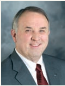
В Интернет Речи и новини от президента на РИ Рон Бъртън ще намерите на www.rotary.org/president