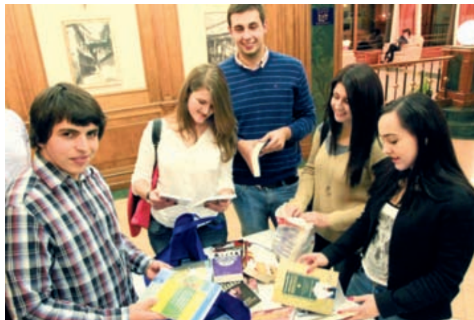
Част от учениците, участвали в тържеството

– Да се съхрани и развива българският дух, да се възпитава младото поколение в дух на любов, родолюбие, историческа и родова памет, национална принадлежност и са-