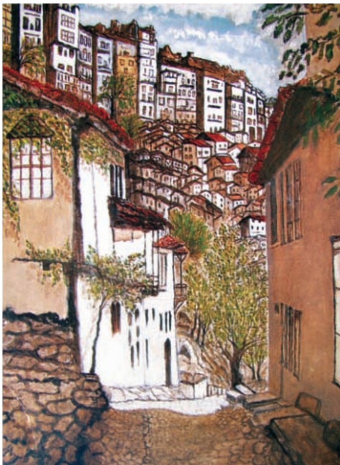
Картичката, издадена от френския дистрикт

търновци да започнат работа по приобщаване на Лясковец към Ротари, и за създаване на клуб в Габрово.