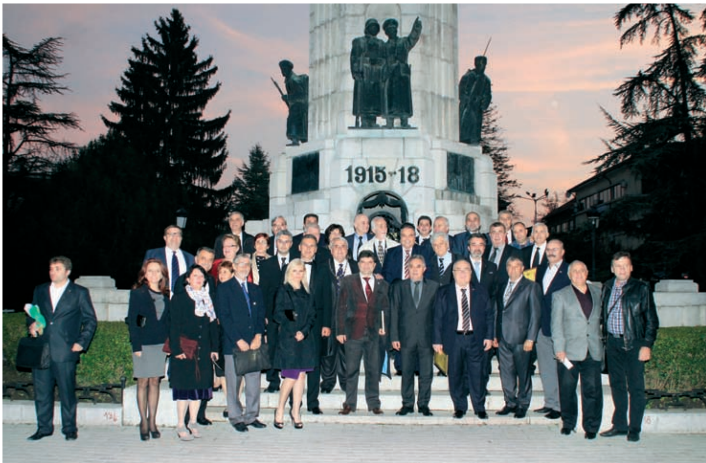
Ротарианците пред паметника „Майка България“.

Благодаря на всички, които са с нас на това тържество във връзка с 75-годишнина от чартирането на първия Ротари клуб в гр. Велико Търново на 1.XI.1938 година.