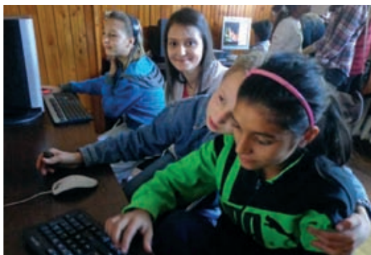
Миг от гостуването на интеракторите през октомври