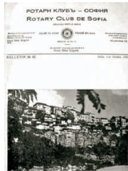
Челната страница на ротарианското списание с информация за Ротари клуб Търново